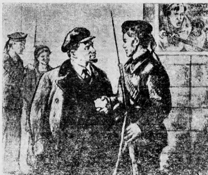
Рисунок художника Н. Н. Жукова «Спасибо матросам!».

Советской молодежи есть чем гордиться. В революционных, трудовых и ратных подвигах, в богатом опыте отцов и матерей она видит яркий пример для подражания.